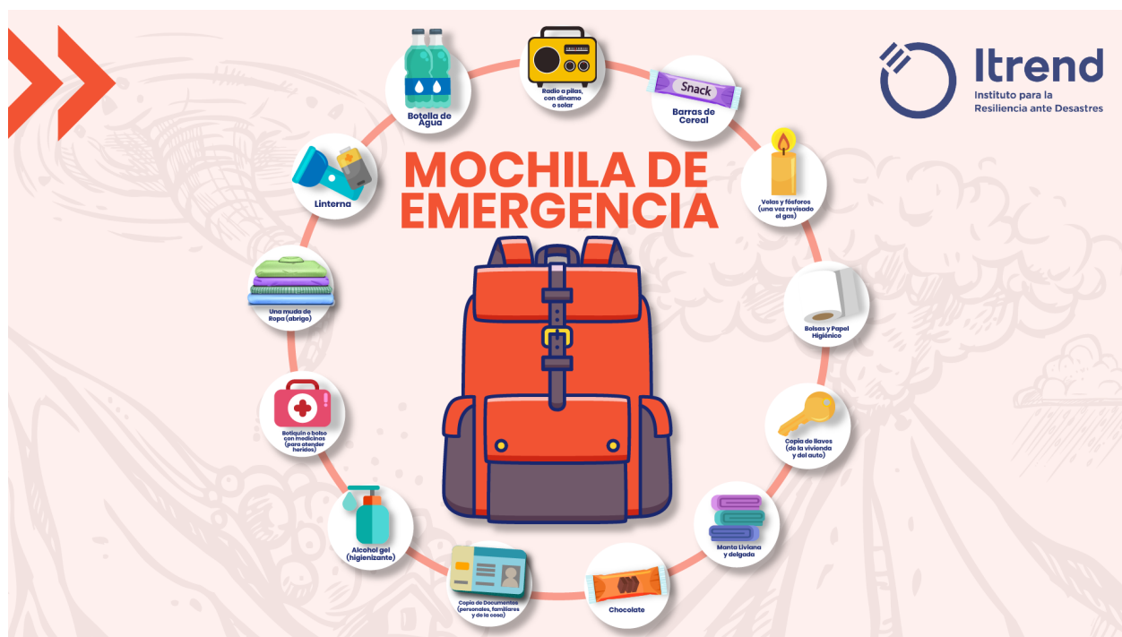
Figura 1. Imagen de los elementos que debe contener una mochila o kit de emergencia.

Como bien lo dice su nombre, un kit de emergencia es un conjunto de artículos básicos que se preparan y guardan juntos para ser utilizados en caso de alguna emergencia (Figura 1).. Estos pueden contener distintos elementos, dependiendo de las personas que los usen. Existen kit de emergencia para niños y niñas, personas con discapacidad, para mascotas o automóviles, y la función que cumplan esto será disponer provisiones esenciales para ayudar a las personas a sobrevivir y afrontar alguna situación de emergencia como desastres socionaturales (terremoto, tsunami, inundación, etc), cortes de energía, entre otros.